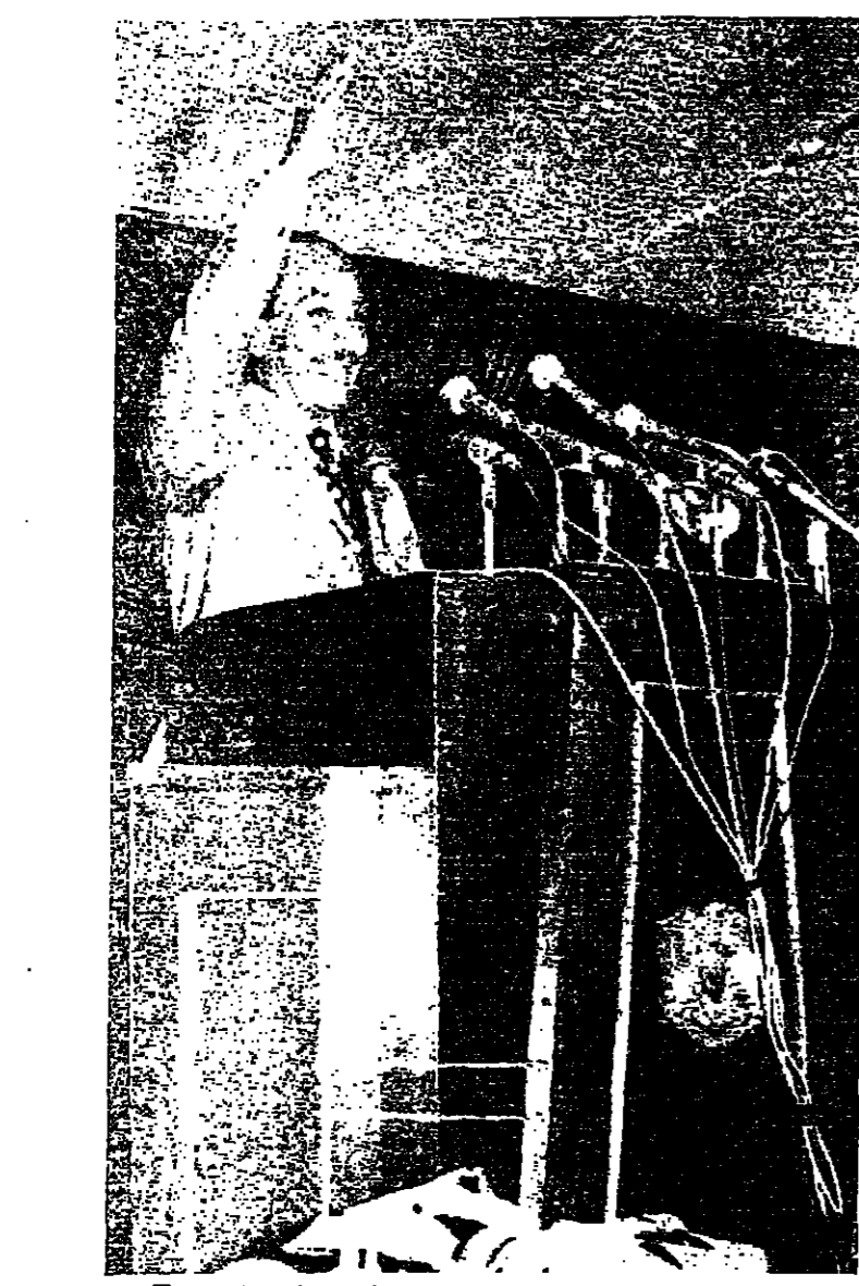
الرئيس المصري يلقي خطبه في أسبوط أمس الأول